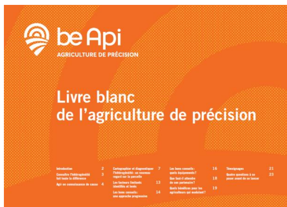
Couverture du livre blanc téléchargeable sur le site beapi.coop (Existe aussi en version imprimée sur demande)