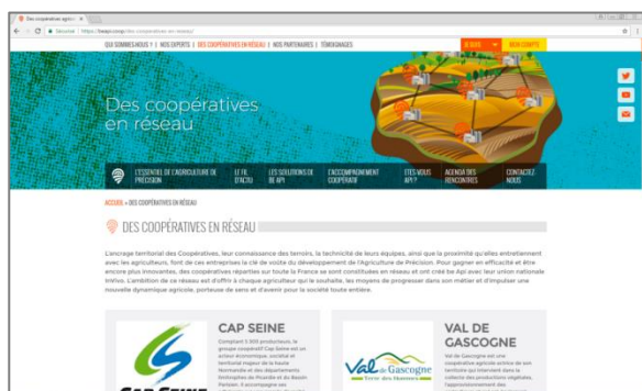
Page du site dédiée aux coopératives du réseau be Api : présentations et témoignages